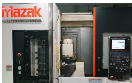
マシニングセンター

現代社会の身近な製品づくりに携わっていることを誇りに、社内の知恵と技術を総動員して、これからも可能性を追求してまいります。